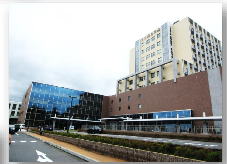
株式会社日立製作所 日立総合病院